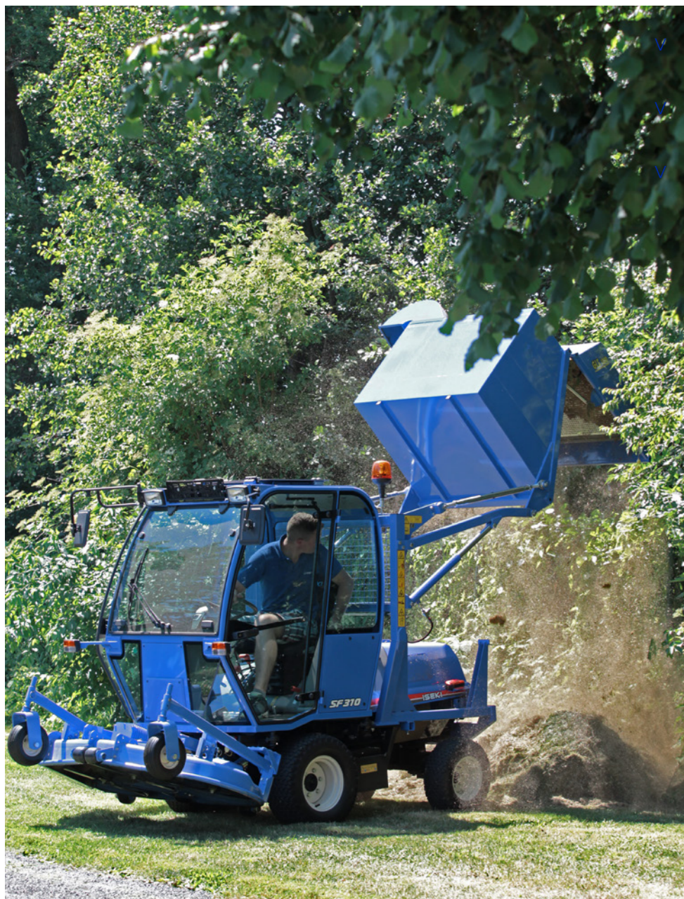
Maszyna jest wyposażona w kosz o pojemności 1.000 l i hydrauliczny wysyp górny umożliwiający rozładunek skoszonego materiału na przyczepę lub do kontenera.

To, co dla laika wydaje się dziwne, dla profesjonalistów w zakładach komunalnych lub zakładach zieleni jest codziennością: olbrzymie trawniki, które muszą być ciągle koszone. Przy takich rozmiarach każdy przestój ma znaczenie, każdy problem techniczny to stracony czas, a każda niewłaściwie skoszony kawałek oznacza dodatkową robotę. Najważniejsza jest zatem możliwość praktycznego zastosowania maszyny. Nasi inżynierowie konstruowali modele SF 310 i SF 370 razem z klientami, biorąc pod uwagę ich potrzeby. Rezultat: synergicznie zaprojektowany produkt.