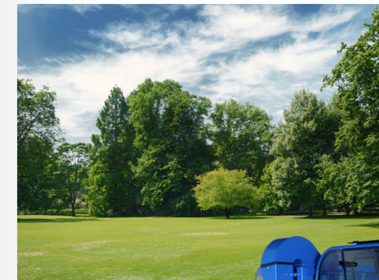
ISEKI SF3 w połączeniu z koszem GLS 1000 potrafi zagęszczać skoszoną trawę i zebrane liście do 50% objętości.