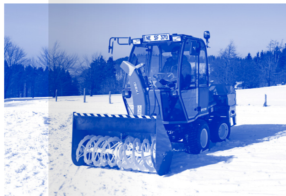
Maszyna wykorzystana także zimą: SF 3 z pługiem wirnikowym.

To, co dla laika wydaje się dziwne, dla profesjonalistów w zakładach komunalnych lub zakładach zieleni jest codziennością: olbrzymie trawniki, które muszą być ciągle koszone. Przy takich rozmiarach każdy przestój ma znaczenie, każdy problem techniczny to stracony czas, a każda niewłaściwie skoszony kawałek oznacza dodatkową robotę. Najważniejsza jest zatem możliwość praktycznego zastosowania maszyny. Nasi inżynierowie konstruowali modele SF 310 i SF 370 razem z klientami, biorąc pod uwagę ich potrzeby. Rezultat: synergicznie zaprojektowany produkt.