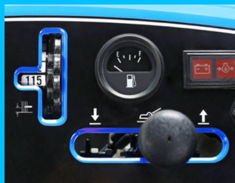
Deska rozdzielcza ze wskaźnikiem stanu paliwa.