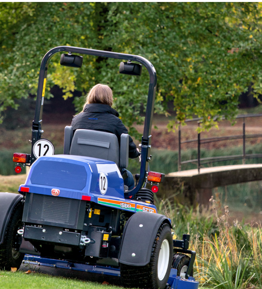
Przednie koła i oś dostosowane konstrukcyjnie do trudnych warunków codziennej pracy.