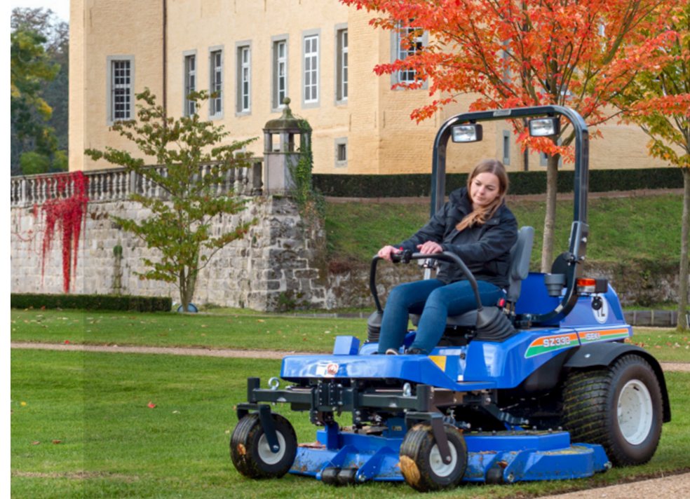
Najwyższy komfort obsługi i precyzja układu kierowniczego były głównymi założeniami konstruktorów.